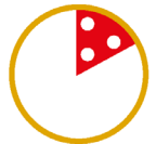
1/6 PIZZA PORZIONE BABY (solo per Menu Baby)

ALLERGENI: come disposto dalla Comunità Europea abbiamo indicato in grassetto i prodotti che rientrano tra gli allergeni. Vi informiamo inoltre che tutti i nostri salumi NON contengono: glutine, lattosio e nemmeno polifosfati