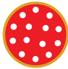
1 PIZZA LINUS LA GRANDE ABBUFFATA

LA PIZZA LINUS HA LA SUA MISURA SCEGLI IL FORMATO PIU' ADATTO AL TUO APPETITO