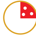
1/4 PIZZA HO VOGLIA DI QUALCOSA DI BUONO