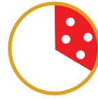
1/3 PIZZA CONSIGLIATA (corrisponde ad 1 pizza tradizionale)