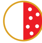
1/2 PIZZA NON CI VEDO PIU' DALLA FAME