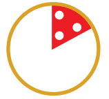
1/6 PIZZA PORZIONE BABY (solo per Menu Baby)

ALLERGENI: come disposto dalla Comunità Europea abbiamo indicato in grassetto i prodotti che rientrano tra gli allergeni. Vi informiamo inoltre che tutti i nostri salumi NON contengono: glutine, lattosio e nemmeno polifosfati